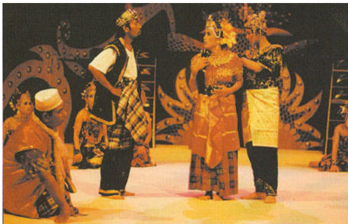
Para pelakon menghayati watak

Apabila Raja Besar pulang ke istana, baginda terkejut dan amat murka kerana melihatkan anaknya bukan manusia. Maka, baginda menuduh Puteri Gerak Petera membuat hubungan sulit lalu menghalau Puteri Gerak Petera dari istana. Puteri Gerak Petera bersama anak gondangnya membawa diri dan mendapatkan perlindungan dari Wak Pakil Jenang, seorang bekas pekerja istana. Baginda juga mengarahkan anak gondangnya untuk dijaga oleh Wak Pakil Jenang semasa bekerja. Akhirnya apabila tiba saat dan ketikanya, gendang menetas dan keluarlah seorang putera dari gondang. Pada awalnya Wak Pakil Jenang tidak mempercayai kejadian itu.