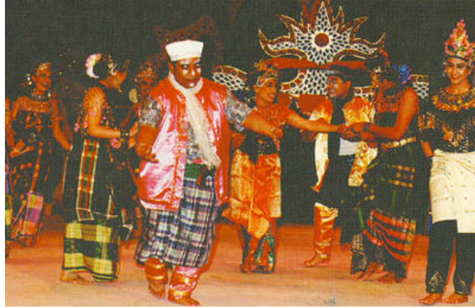
Salah satu babak dalam persembahan makyung