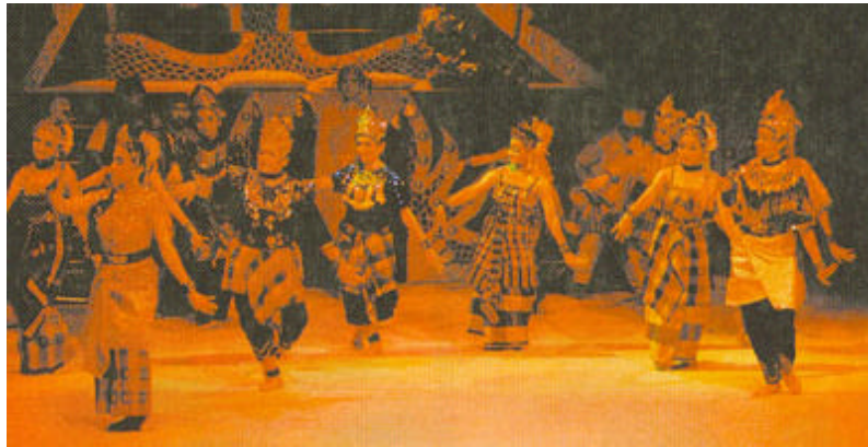
Gerak lari dalam persembahan makyung