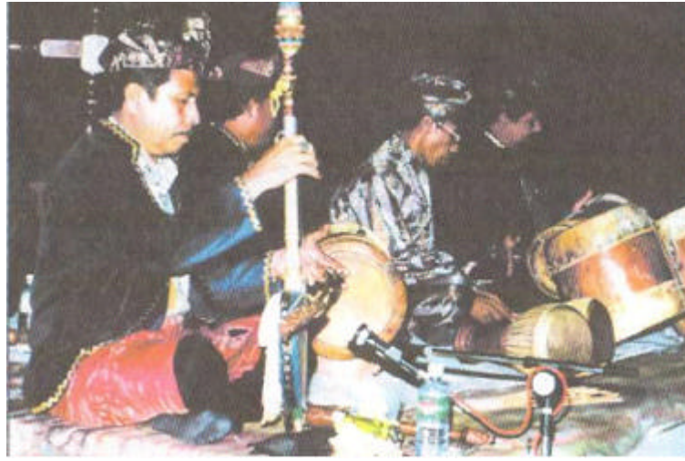
Pemain rebab dikenali sebagai tok minduk