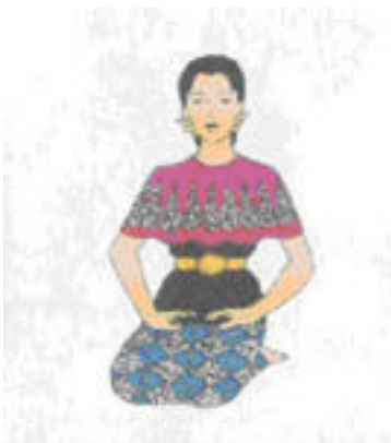
d - Tangan ular sawa mengorak lingkaran