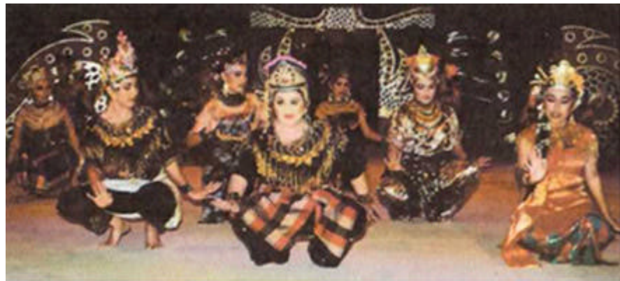
Tarian mengadap Rebab