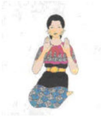
e - Tangan Seludang menolak mayang