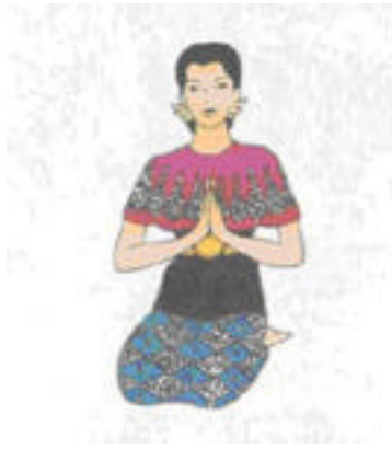
a - Duduk atas tumit, tangan sembah guru