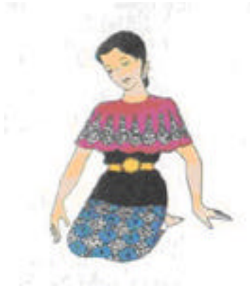
f - Tangan sulur memainkan angin