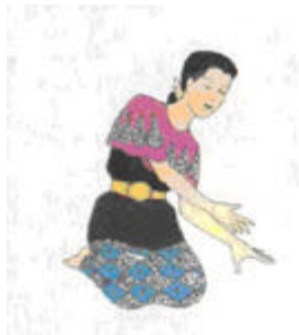
g - Tangan liuk kiri longlai ke kanan