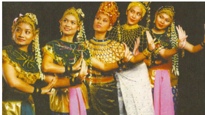
Pelakon lengkap berpakaian mengikut watak