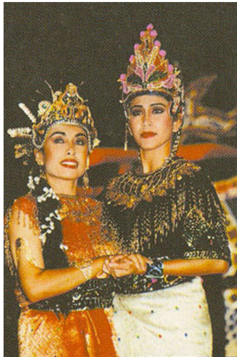
Pakaian dan Perhiasan Puteri dan Pakyung

biasanya bertekad benang emas. Mereka kedua memakai pemeles, tali tangan emas, gelang kaki emas dan cincin pemberian dari raja.