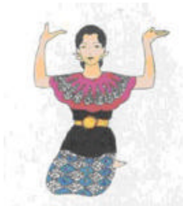
c - Tangan burung terbang