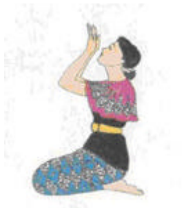
h - Kirat penghabisan